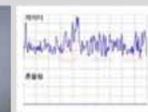
▲ 흰개미 탐지 PEAK