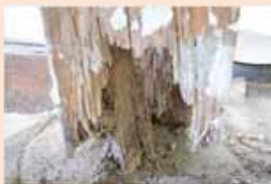
▲ 기둥 하부 흰개미 피해