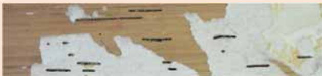
▲ 흰개미 식흔