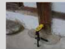
▲ 터마트랙 탐지(실외)

흰개미는 목재내의 성분을 주된 영양원으로 사용하므로, 목재가 재료로 사용되는 모든 구조물, 즉 목조주택, 문화재, 야외 조경시설물, 목조건축물 등이 모두 흰개미의 생존을 위한 생활터전으로 이용될 수 있음.