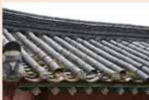
▲ 기와손상으로 지붕 누수 의심