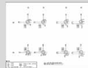
▲ 기동 변위 및 높이 실측도