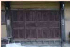
▲ 기둥 변위로 골판문 기능 저하