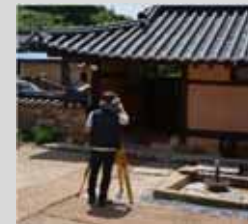
▲ 토털스테이션 변위 측정

부재의 수직·수평 변위를 측정하고 구조물의 현 상태를 관측하여 전체적인 변형 여부를 판단, 이에 따른 변위 및 변형 발생 원인을 파악하여 발생 가능한 문제를 예측하고, 변형된 구조물의 보수 방향을 설정하는 조사방법.