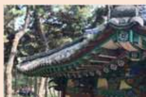
▲ 처마선 처짐으로 지붕부 손상 의심