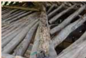
▲ 주녀 상부 흰개미 피해