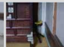
▲ 터마트랙 탐지(실내)