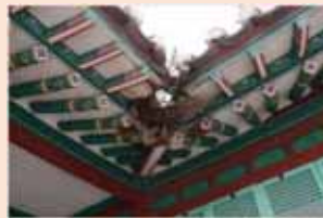
▲ 회첨부 누수로 인한 지붕가구 부후