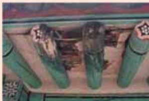
▲ 누수로 인한 지붕가구 부후