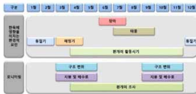
▲ 외부 환경에 따른 한옥 모니터링 프로세스