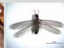
▲ 흰개미 유시충