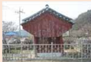
▲ 지반 침하로 전면부 건물 기울음